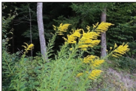
Exemple de néophyte envahissante : la solidage du Canada

Elles peuvent déborder facilement au-delà de la clôture du jardin. Comme elles n'ont pas de concurrents naturels, elles mettent en péril de précieuses espèces indigènes. Elles peuvent aussi être porteuses de maladies et de parasites.